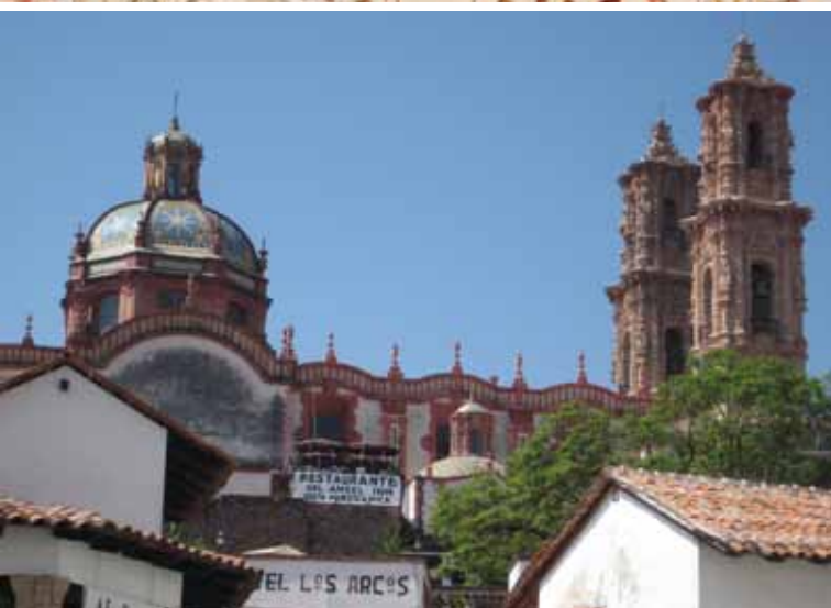
(arriba) Catedral metropolitana, centro histórico, Ciudad de México.