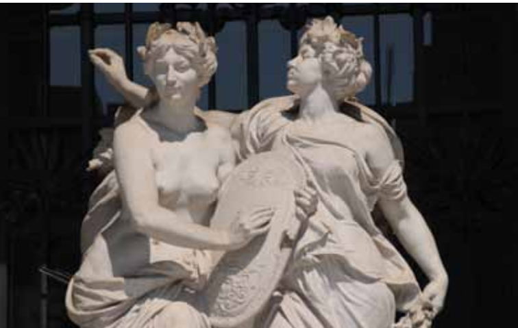
Palacio de Bellas Artes, Ciudad de México.