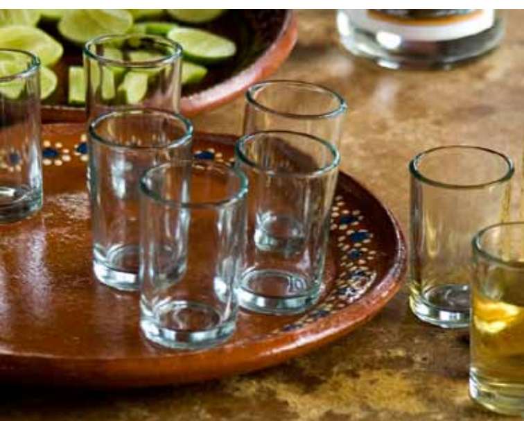
(arriba) Cantina la Ópera, centro histórico, Ciudad de México. Fotografía: Carlos Alvarado (abajo) Cantina, centro histórico, ciudad de México. Fotografía: