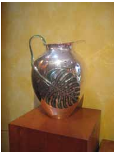
Artesanía, Taxco, Guerrero.