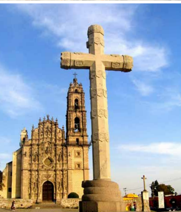
(arriba) Plaza Tolsá, Ciudad de México. (abajo) Tepotzotlan, Estado de México.