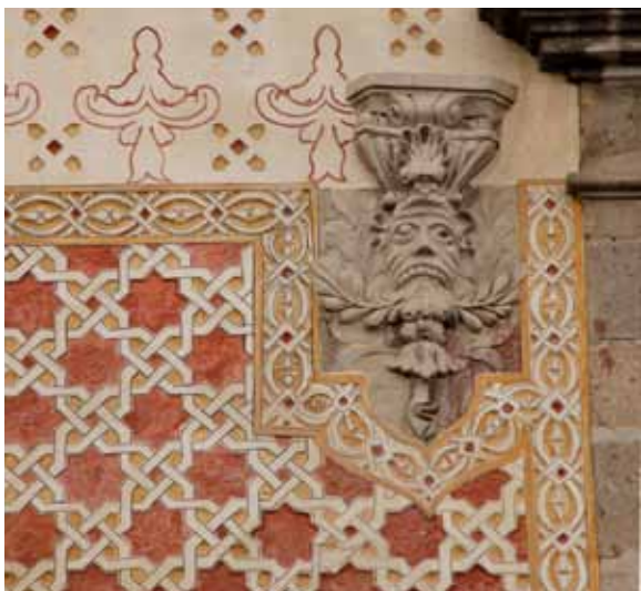
Conjunto Ajaracas, sede de la Autoridad del Centro Histórico, Ciudad de México.