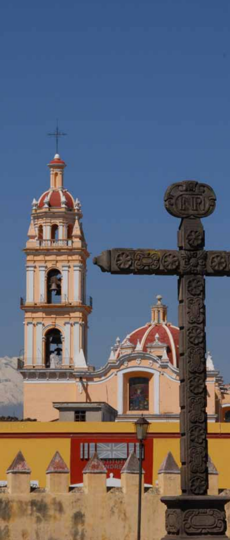
Cholula, Puebla. Fotografía: María Teresa Córdova