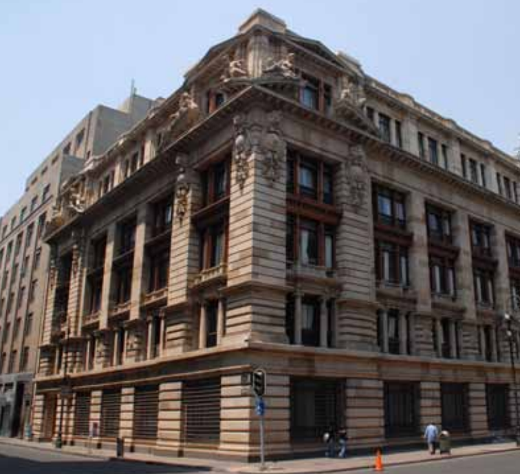
(arriba) Centro histórico, Ciudad de México. (abajo) Centro histórico, Ciudad de México.