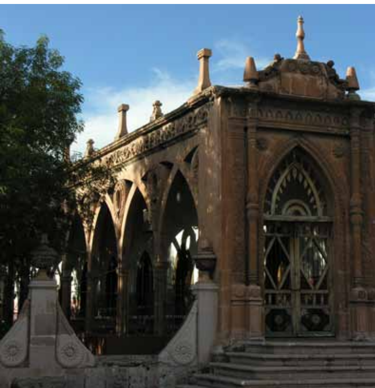
(arriba) Lugar, Aguascalientes. (centro) Lugar, Aguascalientes. (abajo) Lugar, Aguascalientes.