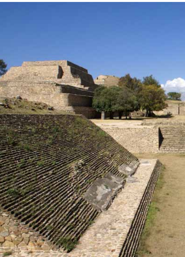
(arriba) Oaxaca. (abajo) Zona Arqueológica de Monte Albán, Oaxaca.