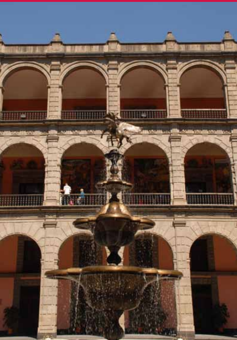
(arriba y abajo) Palacio Nacional, Ciudad de México.