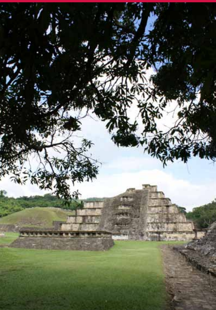
(arriba) Zona arqueológica del Tajín, Veracruz. (abajo) Zona arqueológica del Tajín, Veracruz.