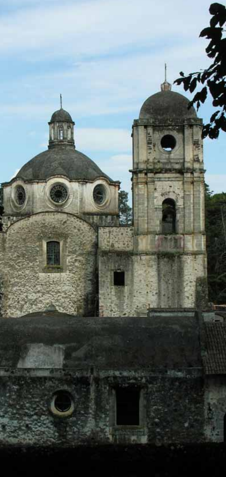
Monasterio Carmelita, Tenancingo, Estado de México.