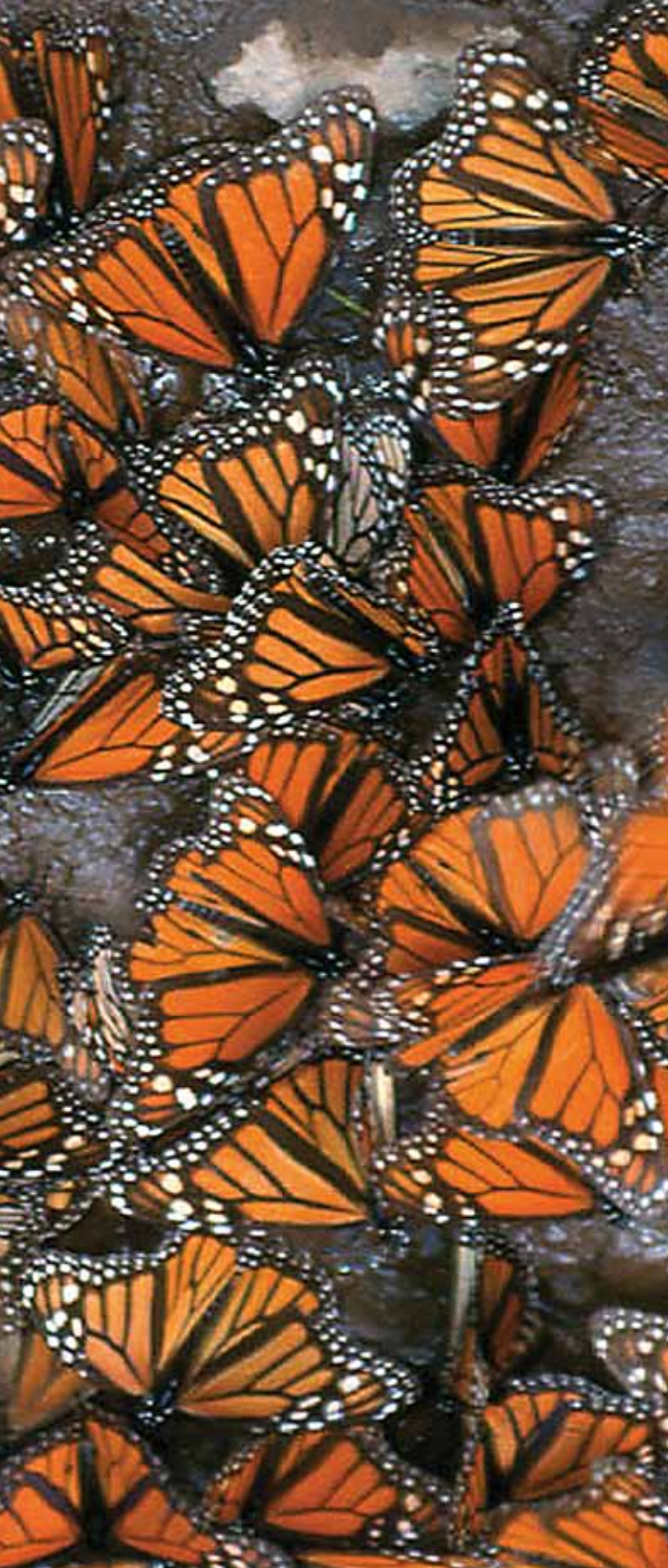
Santuario mariposa monarca.