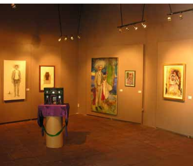
(arriba) Mural en Anenecuilco, Morelos. (abajo) Museo Casa Zapata, Anenecuilco, Morelos. Fotografías: Pendiente