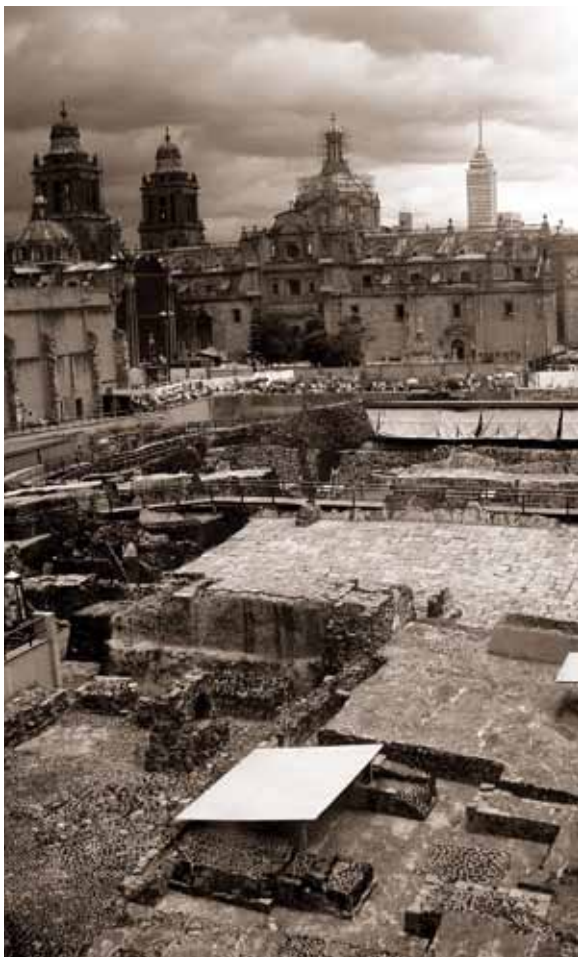
Panorámica del Templo Mayor, Ciudad de México.